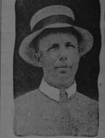
Captán DeForest Chandler quien en pocos días se ha convertido en el mejor de los aviadores del ejército americano. Se propone fundar una escuela de aviación.